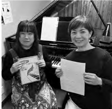
声楽家として、テレビ番組で解説もしている平田先生(左)。2月20日放送のTBS系列「プロフェッショナルランキング」にも出演されました♪