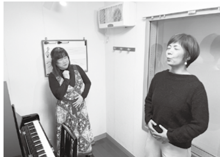
腹式呼吸の練習。腹筋&体幹をめちゃくちゃ使う!

先生曰く、フレーズを滑らかに歌うのがクラシックで、ソプラノならオール裏声。一方、「POPはいろいろなテクニックを駆使