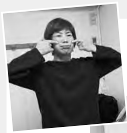
閉じた唇をブルブル震わせて声を出すリップロールは発声練習の基本