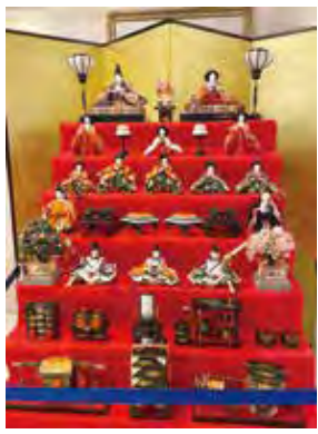
七段のひな飾り (ホテルカデンツァ東京)