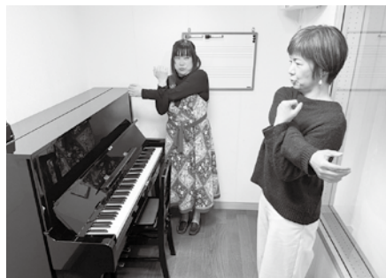
準備体操。上半身を軽くほぐしていきます

出し方や長さをコントロールしやすいです」と先生。そのためには体の力を抜いてリラックスし、しっかりとお腹を使って息をすることが重要だそうです。