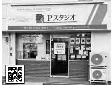
■ Pスタジオ (P.4参照) 練馬区豊玉北1-12-12 ☎03-3992-4994 https://www.p-studio.jp

を出していきます。舌の位置を意識しながら滑舌をクリアにしたり、大きく口を開けて声の出し方を確認したり。常にお腹も意識しなくてはいけないので、想像以上に全身を使う運動でした！