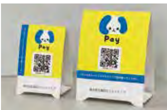
KacceもいたばしPayの加盟店です

板橋の名所をデザインしたTシャツや、板橋の非公認キャラクター「イタバシラカン」など、板橋にちなんだオリジナルグッズの数々も制作。どれも板橋愛を感じます♡さらにはオリジナルコーヒー「いたばしブレンド」まで! 特徴