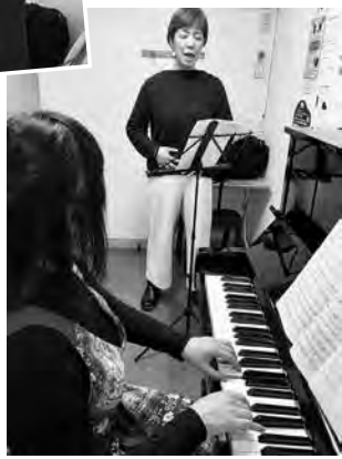
ピアノの生伴奏に合わせて歌える貴重な体験でした♪