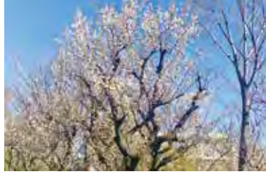
左上:ロウバイ 右上下:梅 (2月20日撮影 田柄梅林公園)